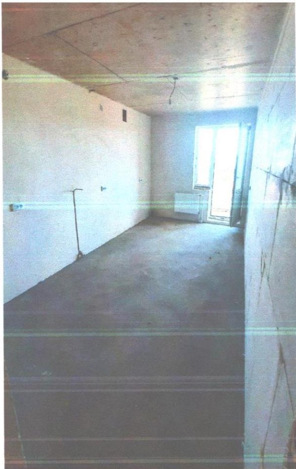
квартира 226 (12).jpg