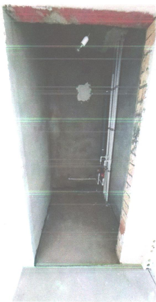
квартира 198 (11).jpg