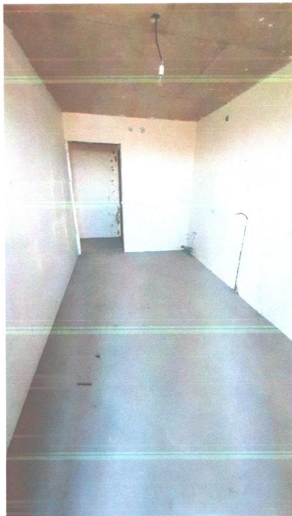
квартира 226 (13).jpg