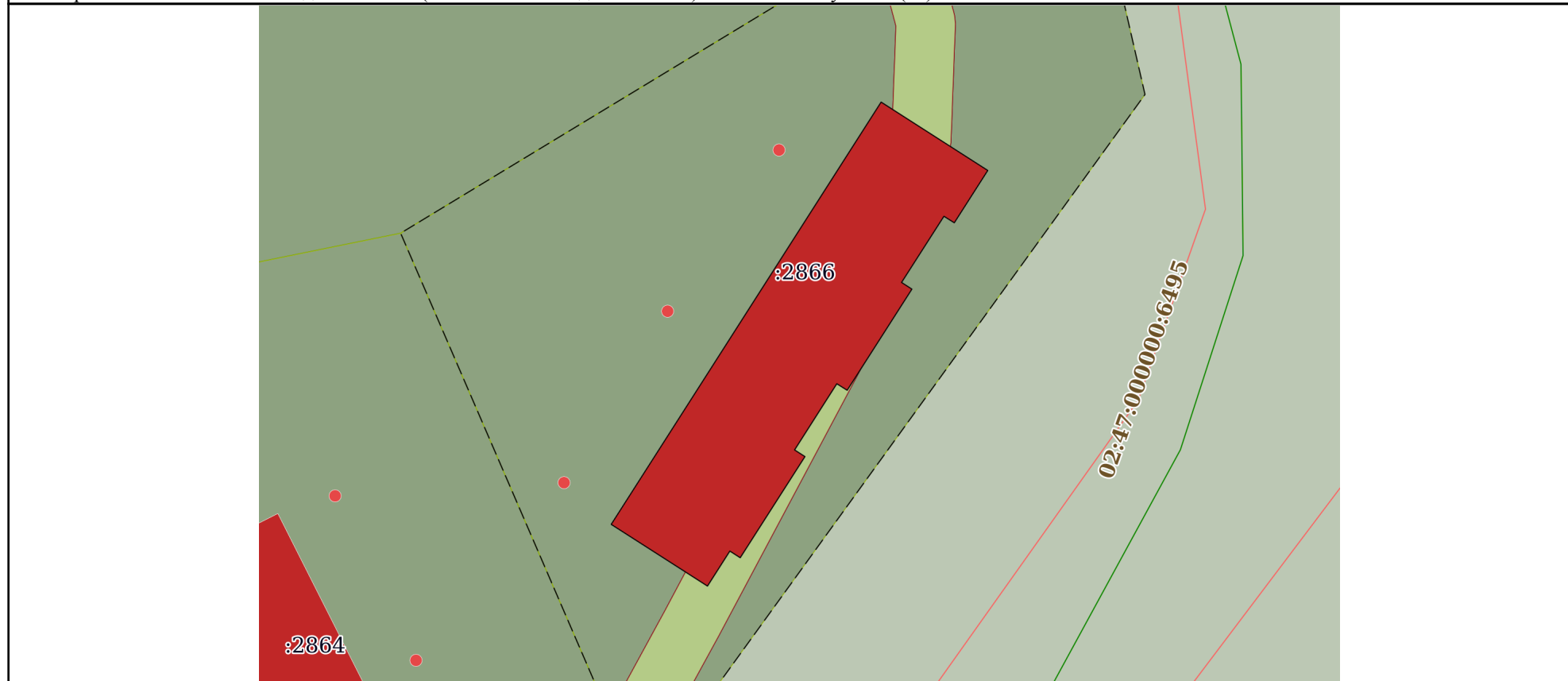
Схема расположения объекта недвижимости (части объекта недвижимости) на земельном участке(ах)