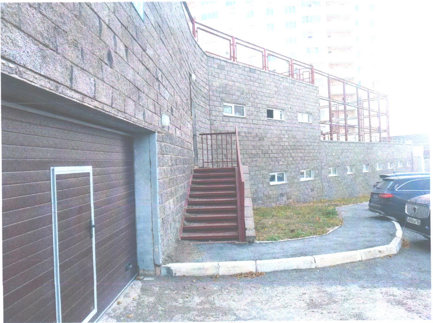
общий вид (2).jpg