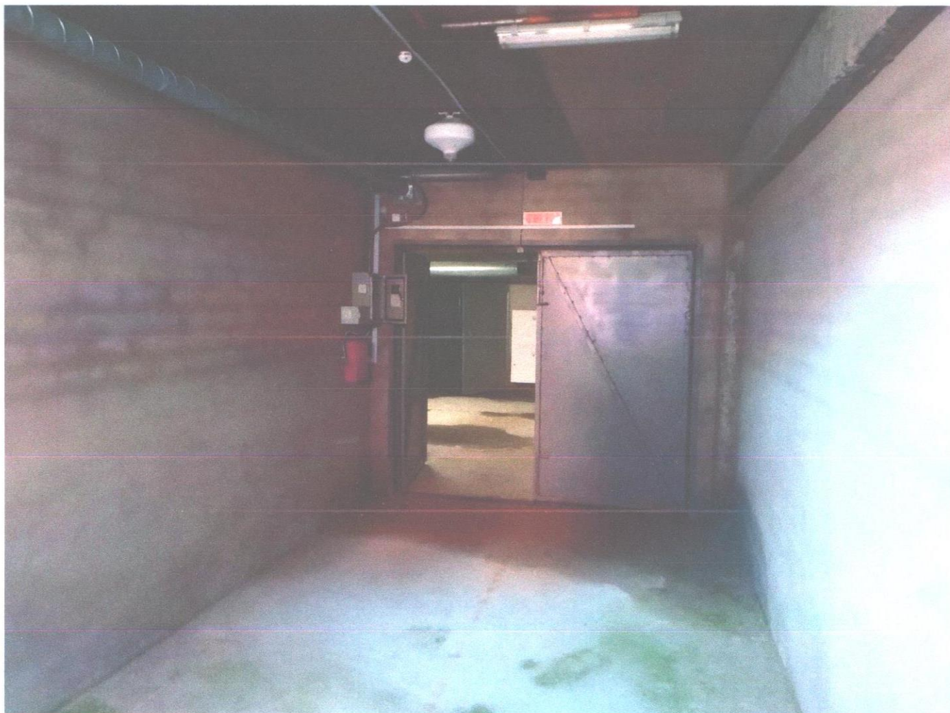
бокс 44 (5).jpg