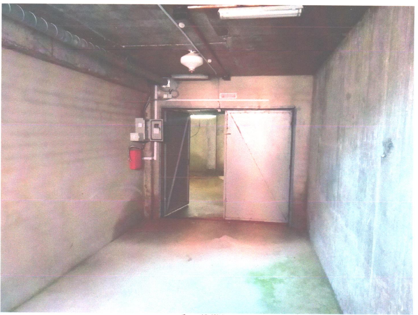
бокс 43 (3).jpg