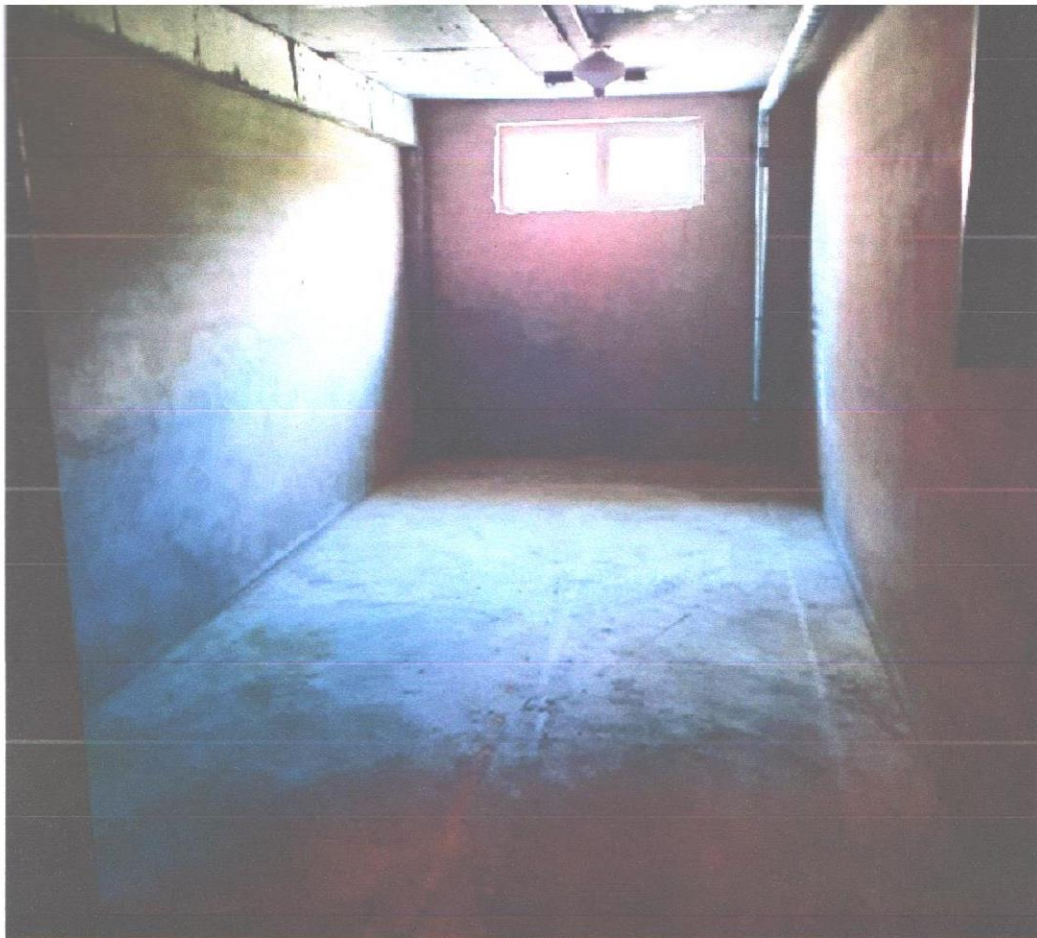
бокс 44 (2).jpg