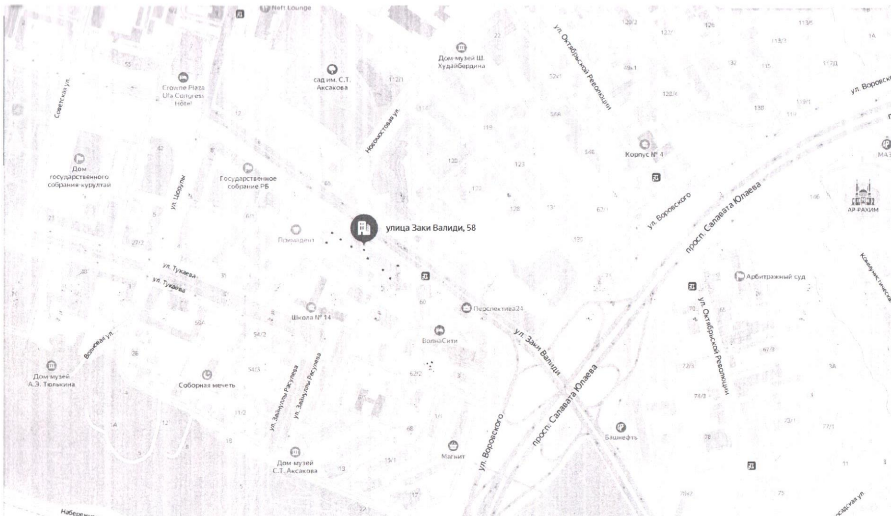
Рис. 1. Местоположение объекта оценки