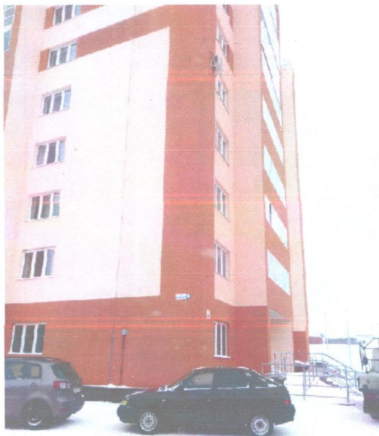
общий вид (3).jpeg