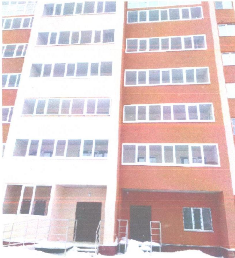
общий вид (1).jpeg