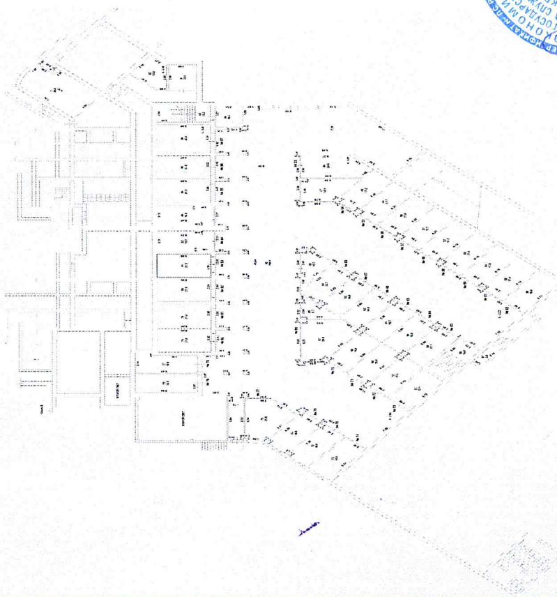
План 1 уровня с/машАБ