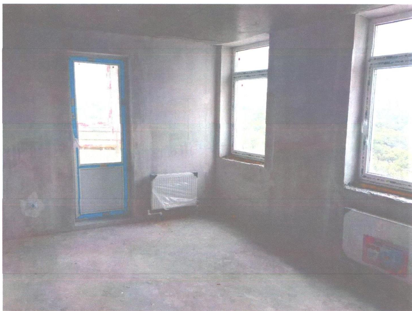
квартира 135 (11).JPG