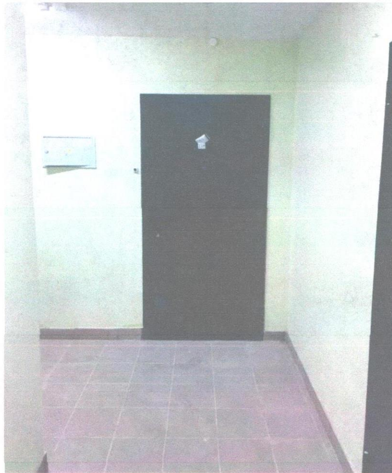
квартира 135 (1).JPG