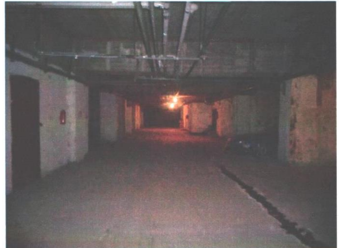
Фотография 3.6. Общий вид помещения здания