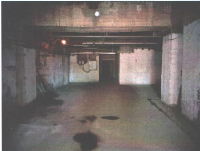
Фотография 3.5. Общий вид помещения здания