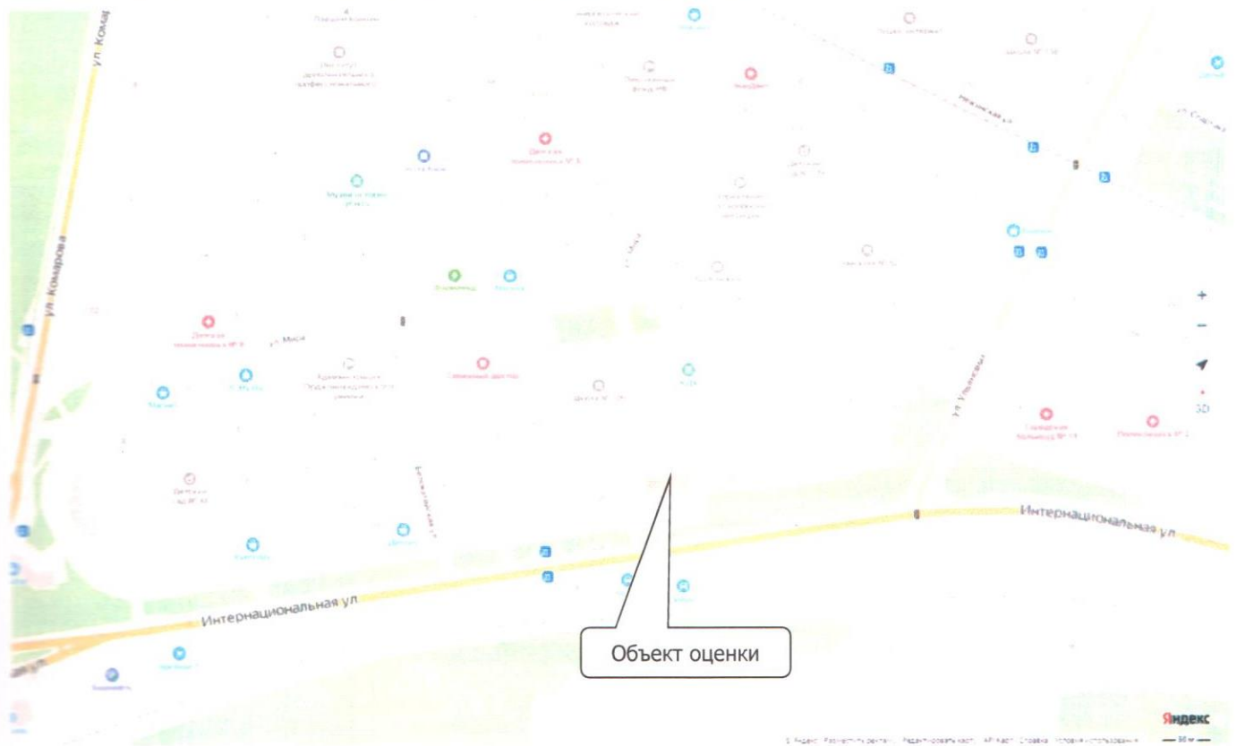
Рисунок 3.3. Расположение Объекта оценки в микрорайоне

Локальное расположение объекта недвижимого имущества показано на рисунке 3.3.