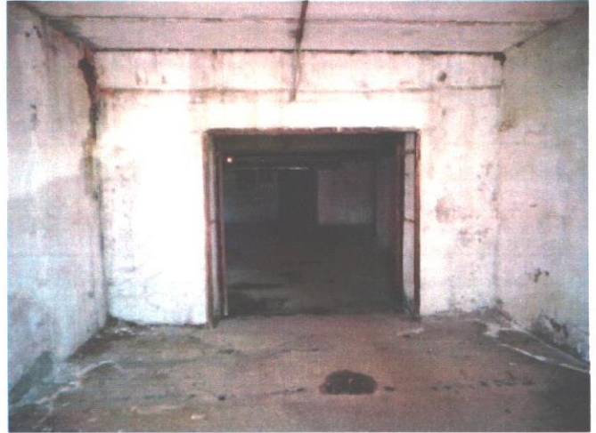
Фотография 3.4. Общий вид помещения здания