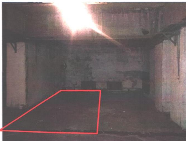
Фотография 3.7. Оцениваемое машино-место №7