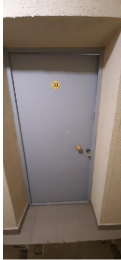
Прихожая, 6,6 кв.м. (помещение № 1)

Внешний вид квартиры расположенного по адресу: Республика Башкортостан, Янаульский район, г. Янаул, ул. Победы, д. 101, кв. 53 Входная дверь в квартиру № 53